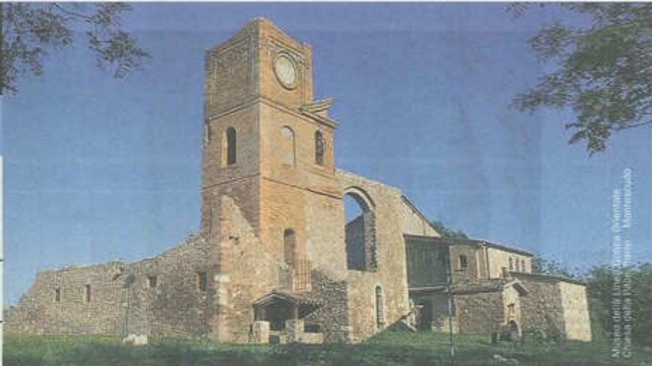
Museo della Linea Gotica Orientale - Montescudo Chiesa della Madonna - Montegrolfo

Co-funded by the Europe for Citizens Programme of the European Union